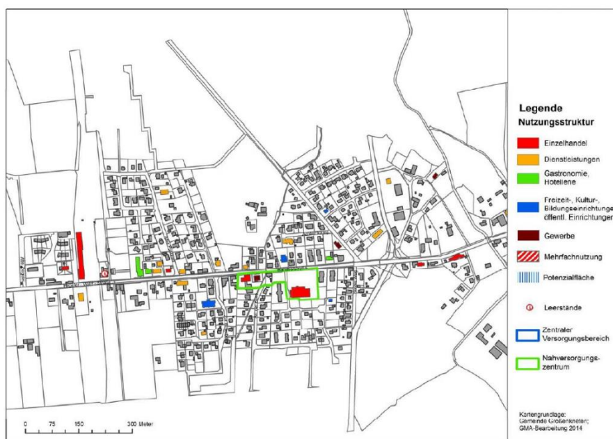
Abb. 1 Nahversorgungszentrum Huntlosen

Für das Gemeindegebiet liegt die Fortschreibung des Einzelhandelsentwicklungskonzeptes aus dem Jahr 2015 vor. Es handelt sich hierbei um ein zu berücksichtigendes Städtebauliches Entwicklungskonzept nach § 1 Abs. 6 BauGB. Demnach befinden sich der in Großenkneten ausgewiesene Zentrale Versorgungsbereich und das Nahversorgungszentrum Huntlosen innerhalb des Geltungsbereiches der vorliegenden Flächennutzungsplanänderung (siehe Abbildung 1 & 2).